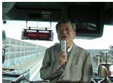
バスの中で例会会長挨拶