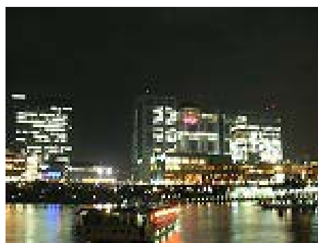
船から見たお台場