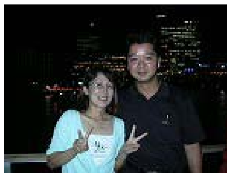
大熊親睦委員長お疲れ様でした