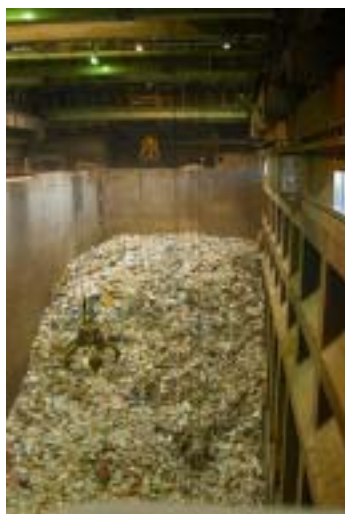
ビット内のゴミの量